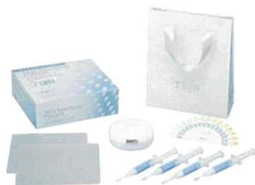
高度管理医療機器