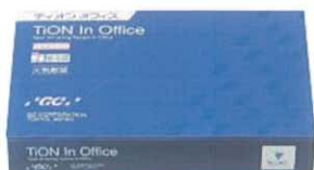
高度管理医療機器