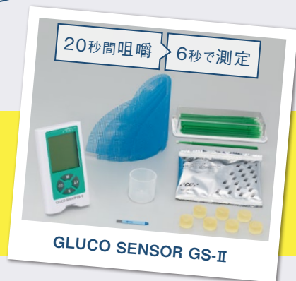
GLUCO SENSOR GS-II