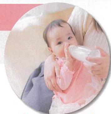
妊娠期・乳幼児期