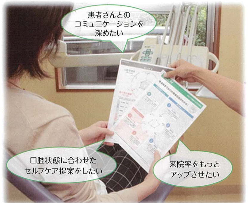
(患者さまとの結果共有シーン/イメージ)