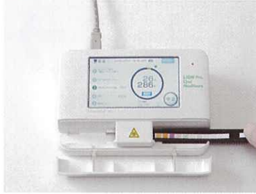
「試験紙と専用機器で測定」