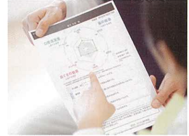
「測定結果を患者さまと共有」