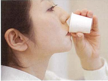
「10秒間、軽く洗口する」