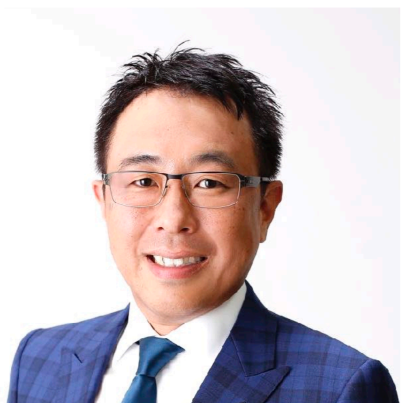
Endodontics 神戸 良