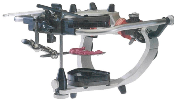
プロター evo 7 歯科用咬合器 医療機器届出番号:27B1X00149000013 一般医療機器