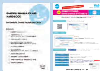
左: DR・DT会員専用「SHIKA CLUB HANDBOOK」 右: 会員用「SHOFU Seminar サイトの使い方」