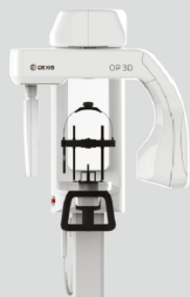
ORTHOPANTOMOGRAPH™ OP 3D

“Diagnosis and Examination” X-ray Imaging Solutions Meeting