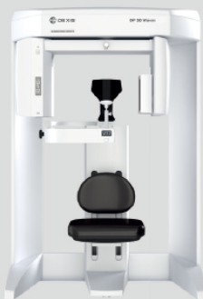
ORTHOPANTOMOGRAPH™ OP 3D Vision

DEXIS (デキシス)CBCTを より効果的に、最大限にご活用いただけるよう、ユーザーの先生方に日頃の感謝を込めてDEXIS 3DCTユーザーズミーティングを全国各地で開催いたします。本ミーティングは、様々な分野において臨床経験豊富な先生方より、症例を交えながら3Dデータの有効活用方法や臨床応用例に関するご講演を予定しており、例年多くの参加者の皆様よりご好評の声を頂いております。