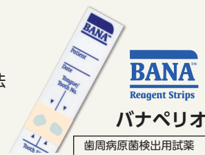
体外診断用医薬品承認番号 21400AMY00214000

Point 事前アンケートからお悩み解決にお答えします (※事前アンケートにご協力ください。)