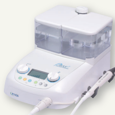
acteon スプラソン P-MAX2 医療機器認証番号 224ALBZX00039000 管理医療機器 特定保守管理医療機器

「なんとなく使用している。」「あるから使っている。」ではもったいない！患者さんにとって、そして術者にとっても時短で痛みなく施術を受けていただくことはリピート率UPだけでなく歯科衛生士の信頼度も高まります。そのためには、歯科医師と場を共有することが近道であるため是非一緒に参加ください。歯科衛生士のみも歓迎です。超音波SRP・メンテナンス活用など超音波スクレーラーに必要な知識と技術をマルっとお伝えします。