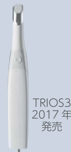
TRIOS3 2017年 発売